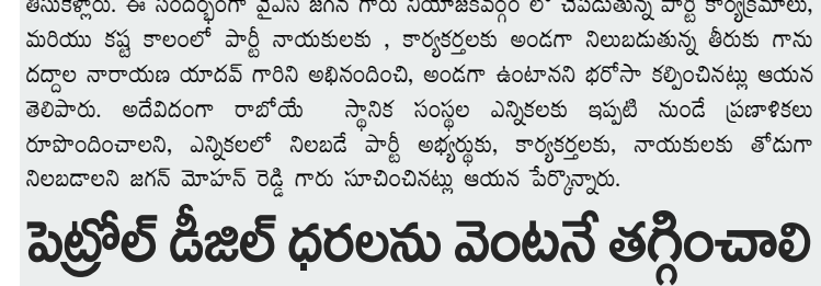
కనిగిరి స్వర్ణ సాగరం మే 27