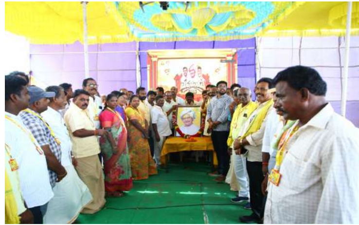
విజనరీ ముఖ్యమంత్రి నారా చంద్రబాబు నాయుడు ఓజిబిలో అట్టహాసంగా వర్చువల్ మహానాడు