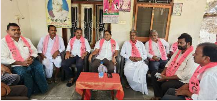
స్వర్ణసాగరం డోర్లకల్ మే 27

రైతులు పండించిన ప్రతి ధాన్యం గింజను ప్రభుత్వమే కొనుగోలు చేయాలి బి ఆర్ ఎస్ మాజీ ఎమ్మెల్యే డిఎస్ రెడ్డానాయక్