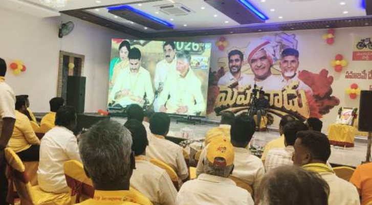
పూతలపట్టు స్వర్ణ సాగరం మే 27