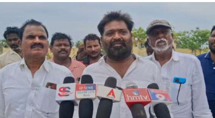
మండల రెవెన్యూ అధికారులకు మాజీ సర్పంచ్ గ్రామస్థుల విజ్ఞప్తి తోటపల్లి గూడూరు స్వర్ణసాగరం మే 27