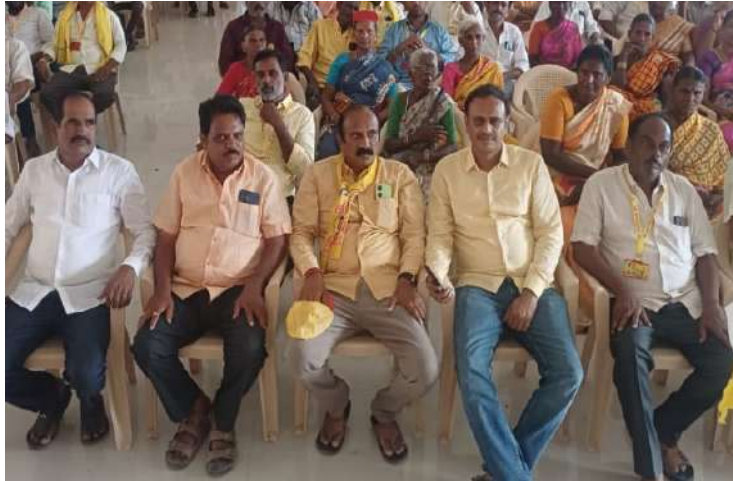
బంగారుపాళ్ళం, స్వర్ణసాగరం, మే 27