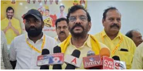
1872 క్లస్టర్లో మహానాడు వీక్షణం టీడీపీ జెన్నెట్యానికీ సంకేతం మాజీ మంత్రి “కాకాజీ”

విలుకానిపల్లి మహానాడు 4.5 క్లస్టర్ వర్చువల్ వీక్షణ సందర్భంగా ఎమ్మెల్యే సోమిరెడ్డి తోటపల్లి గూడూరు స్వర్ణసాగరం మే 27